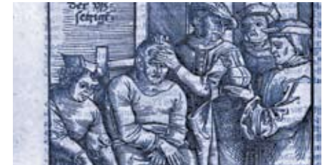
H. von Gersdorff, Feldtbuch der Wundartzney, 1517