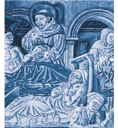
Leprakranken, Miniatur, 15. Jh.