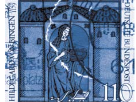
Hildegard von Bingen, Briefmarke, 20. Jh.

Heute beginnt die äußerliche Behandlung der Psoriasis mit der richtigen Hautreinigung, am besten mit rückfettenden Seifen, z. B. mit Glycerin, Vitamin E oder Kollagen, um den Säureschutzmantel der Haut zu erhalten. Um ein zu starkes Entfetten und Austrocknen der Haut zu verhindern, gilt beim Duschen oder Baden die Devise „ Weniger ist mehr “. Zudem sind rückfettende Dusch- und Badezusätze empfehlenswert. Beim Abtrocknen reizt vorsichtiges Trockentupfen die Haut weniger als kräftiges Abrubbeln. Und statt der im Mittelalter vorgeschriebenen „härenen Gewänder“ sind weiche Stoffe wie z. B. Baumwolle empfehlenswert.