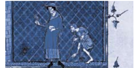
Leprakranker mit Klapper, Miniatur, 15. Jh.