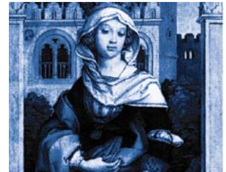
Heilige Elisabeth, Ölgemälde, 15. Jh.