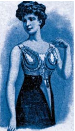
Platen, Naturheilkunde, 1900