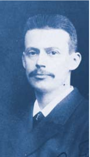
N. Finsen, Fotografie, 19. Jh.

therapie: Psoralen plus UV-A. Daneben hat sich die Balneophototherapie entwickelt: Dabei wird die ambulante UV-B-Bestrahlung mit Salzbädern kombiniert.