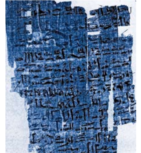
Papyrus Smith, Fotografie, 19. Jh.