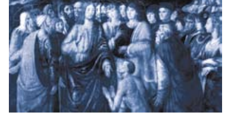
C. Roselli, Christus heilt einen Leprakranken, 15. Jh.

Viersäftelehre war übrigens bis ins 19. Jahrhundert hinein weitgehend akzeptiert. Erst als man mit immer besseren Mikroskopen die Zellen entdeckte und Bakterien isolierte, änderte sich das medizinische Weltbild. In den Jahren 1873-1880 wurde die Lepra als ansteckende Krankheit erkannt und Mycobacterium leprae als Erreger nachgewiesen. Und die Entstehung der Psoriasis? Hier tat man sich noch schwerer. Der Verlauf der Psoriasis, der Einfluß äußerer Faktoren, die Vorgänge in den Hautzellen selbst und Fragen der Erblichkeit gerieten ins Zentrum der „ Ermittlungen “. Auf der Basis neuer Erkenntnisse in der Genforschung, der Immunologie und der Stoffwechselprozesse der Zellen kristallisierte sich das heutige Verständnis heraus. Durch genetische Veranlagung und durch Umweltfaktoren (z. B. Stress) kommt es zur Entzündung der Haut, zu einer massiven Steigerung der Zellteilung von Oberhautzellen und zum Entstehen von schuppigen, entzündlichen Hautveränderungen, den Plaques.