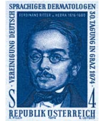
F. von Hebra, Briefmarke, 20. Jh.

Heute sprechen wir von der Psoriasis vulgaris, der gewöhnlichen Psoriasis vom Plaque-Typ oder je nach Erscheinungsform z. B. auch von einer Psoriasis generalisata, die überall auf der Haut auftritt. Oder einer Psoriasis nummularis, die sich durch runde, an Münzen erinnernde Plaques (Willans Silberpfennig!), zeigt. Und typische Merkmale sind das Kerzenwachsphänomen, das Phänomen des letzten Häutchens und das Phänomen des blutigen Taus.