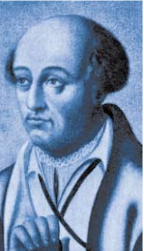
Paracelsus, Lithographie, 19. Jh.

Auch hier wurde in den letzten rund 50 Jahren eine breite Palette an Alternativen entwickelt, von Methotrexat bis hin zu monoklonalen Antikörpern.